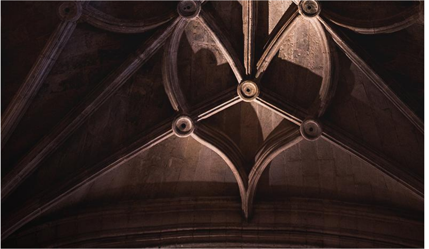
22/04/2025 Sesión ordinaria de Consejo de Gobierno de 29 de abril de 2025